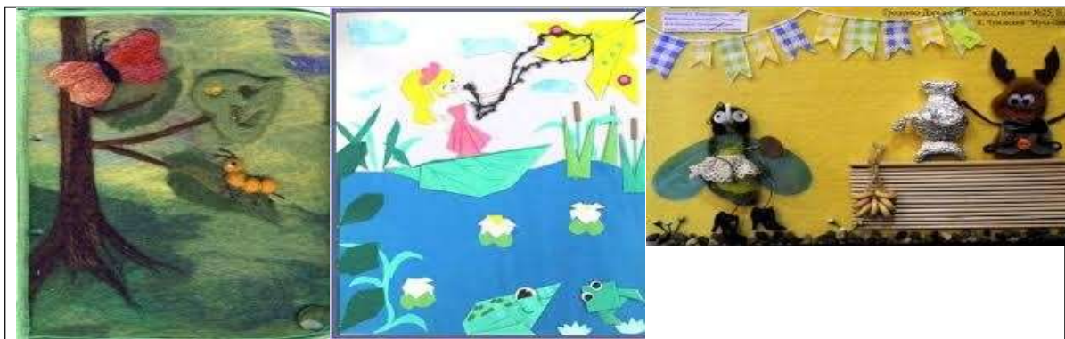
Рис. 2. Тактильные иллюстрации в разных техниках (валяние из шерсти, оригами, аппликация).